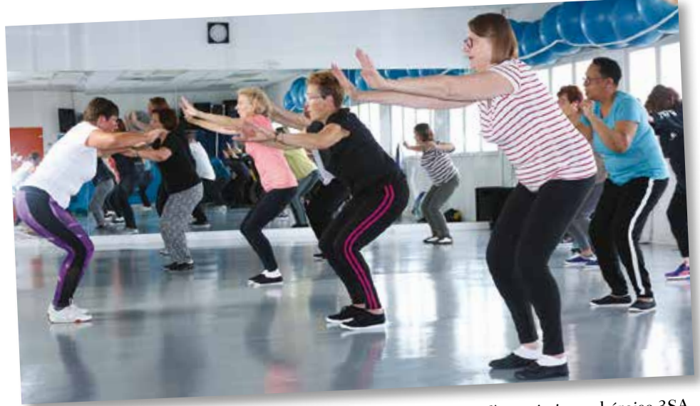
| Cours de gym de maintien dans la bonne humeur avec l'association achéroise 3SA.

On s'y sent bien. La réputation de la résidence est bonne, il n'y a pas beaucoup d'établissements comme celui-là. Il perpétue l'esprit village d'Achères. C'est un lieu vivant : repas régionaux, semaine du miel et barbecues permettent rencontres et partage.