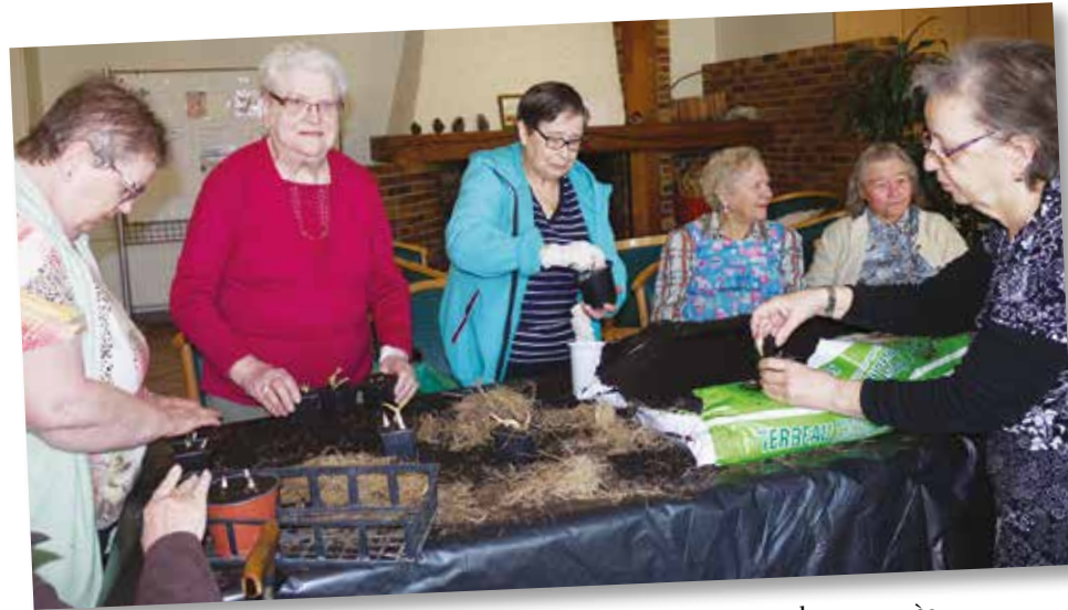
| L'atelier "Jardin bien-être" rencontre un beau succès. Ici, la préparation du muguet en avril dernier.

loto) et des sorties (Pandora, restaurant).