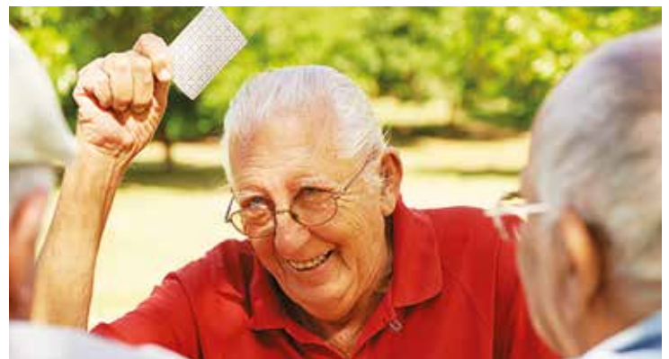
| A Achères, le “Mois des personnes âgées” est l'occasion d'organiser des événements mais surtout de faire prendre conscience de la place et du rôle social que jouent nos Aînés dans notre société.