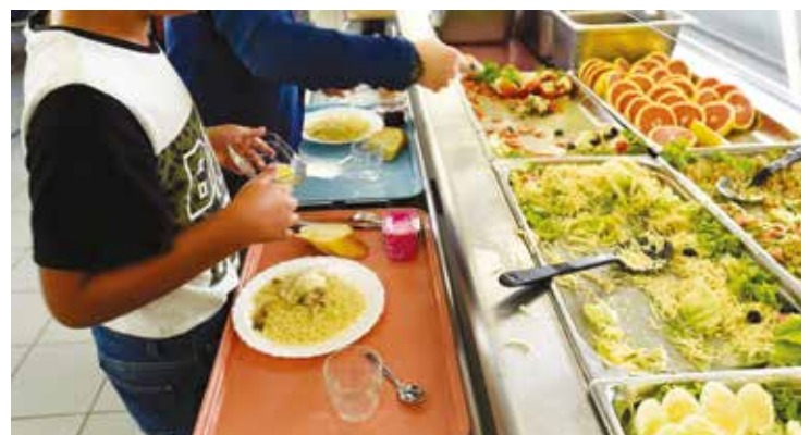
| La Ville et le CCAS ont fait le choix d'une nouvelle offre de restauration collective “bio” pour l'ensemble des écoles, centres de loisirs, agents municipaux et Achérois bénéficiant du portage à domicile.