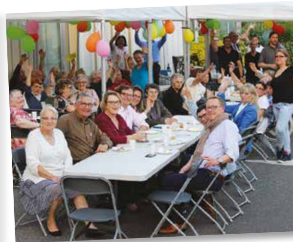
| Déjeuner en plein air à la Résidence à l'occasion de la Fête des voisins.