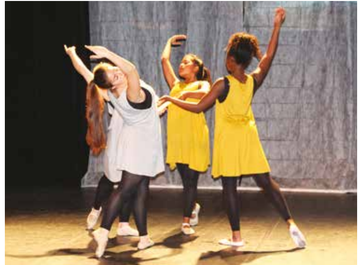
| Sax, Pandora, CRC, Bateau Vivre, Centre culturel, bibliothèque multimédia : à Achères, la culture est POUR tous, PAR tous et PARTOUT...