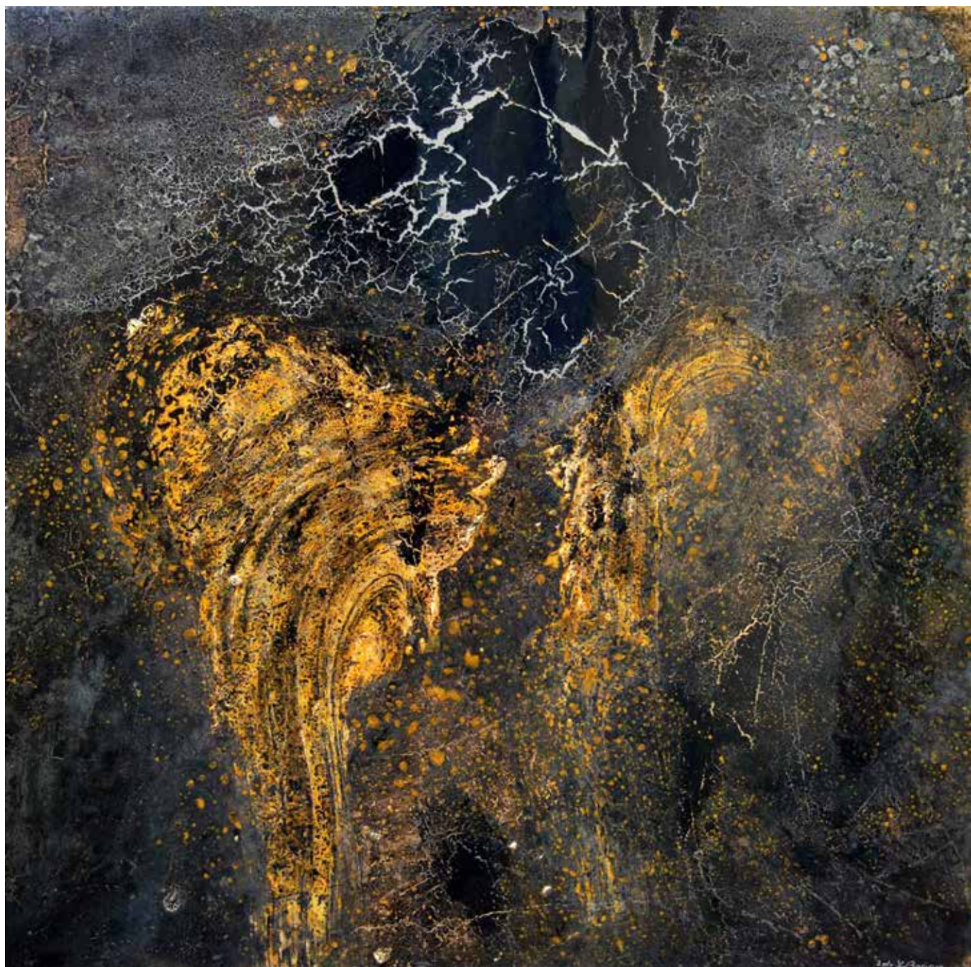
Sans titre , 2010, résine sur bois, 122 x 122 cm